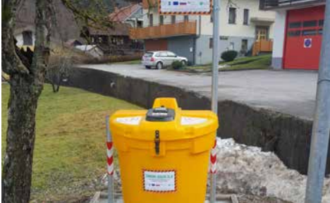
Zbiralnica odpadnega jedilnega olja na Bukovici