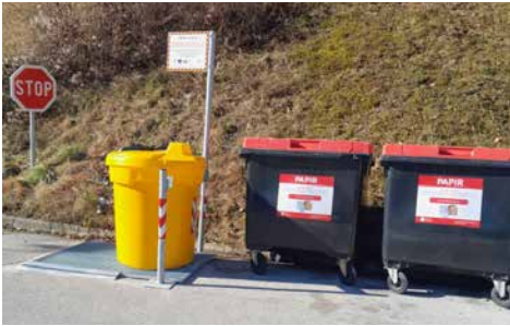
Zbiralnica odpadnega jedilnega olja v Logu nad Škofjo Loko

V okviru projekta Čisto Škofjeloško je Komunalna Škofja Loka postavila 5 zbiralnic odpadnega jedilnega olja na podeželskih območjih v občini Škofja Loka (točne lokacije spodaj pod fotografijami). Šesta zbiralnica bo postavljena v naselju Zminec v poletnih mesecih, ko bo urejen tudi nov ekološki otok za zbiranje ločeno zbranih odpadkov. Vabimo vas, da olje v gospodinjstvih ustrezno zbirate in prelijete v rumene zbiralnice za odpadno jedilno olje.