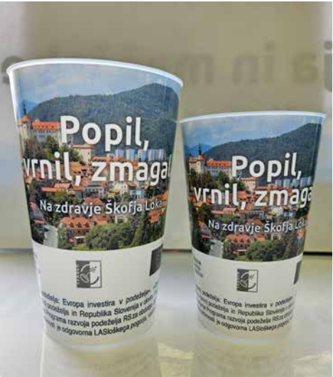
Kozarčki za večkratno uporabo Zavoda Poljanska dolina in Komunalne Škofja Loka