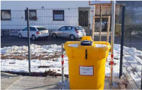
Zbiralnica odpadnega jedilnega olja v Puštalu