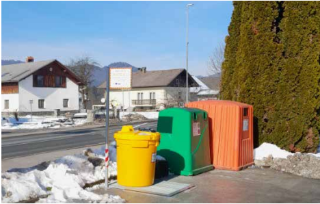
Zbiralnica odpadnega jedilnega olja pri Svetem Duhu