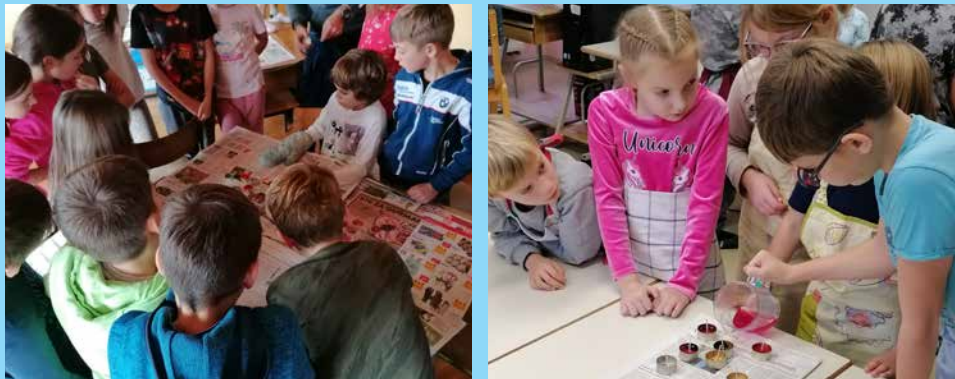
Utrinki z delavnic izdelave svečk v šolah v Javorjah in v Bukovščici

Delavnice izdelave svečk iz odpadnega jedilnega olja na treh podružničnih šolah so bile že izvedene, o teh tematikah bomo ozaveščali na dogodkih na širše Škofjeloškem, izvedli strokovna izobraževanja za odrasle, predstavljen bo predlog strategije zero waste Občine Gorenja vas – Poljane, za organizatorje različnih prireditev oz. dogodkov pa pripravljamo tudi delavnice izmenjave dobrih praks oz. izkušenj z izvedbo zero waste dogodkov.