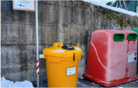
Zbiralnica odpadnega jedilnega olja v Stari Loki