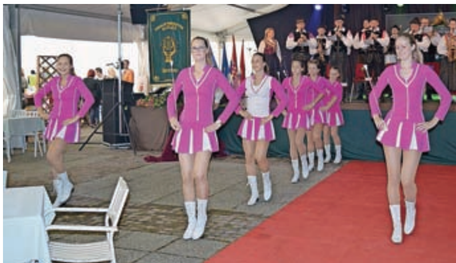
Godbenike so v Lepoglavi spremljale tudi članice Mažoretnega društva Železniki.

V pihalnem orkestru bodo veseli tudi novih članov, zato vabijo tiste, ki igrajo trobila, pihala ali tolkala, naj se jim pridružijo.