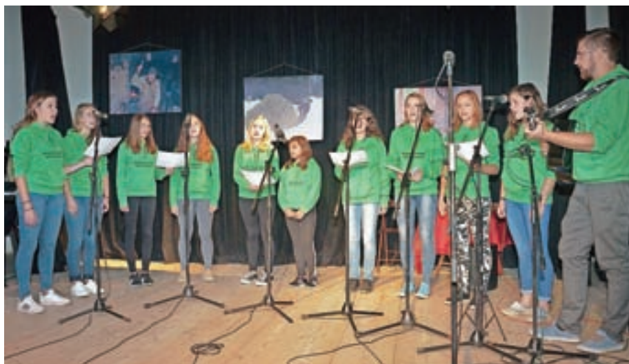
Dekliški zbor iz Davče

V soboto, 23. septembra, je Loški muzej v dvorani Gostišča macesen predstavil razstavo, ki jo je pripravila kustosinja