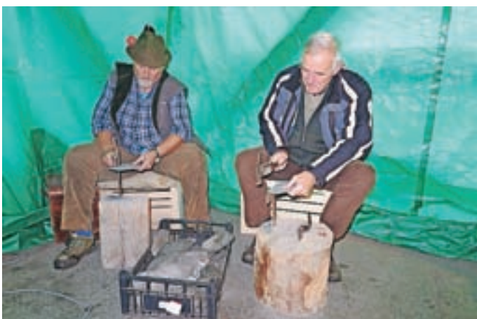
Prikazali so tudi obdelavo škrlja.