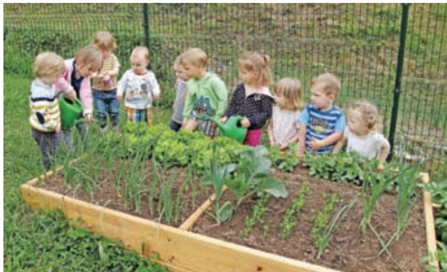
Otroci zalivajo in občudujejo vrt

Povezali smo se z lokalnimi pridelovalci hrane, ki nam priskrbijo zdravo, ekološko pridelano hrano. Skoraj vsi pridelovalci te hrane imajo otroke v našem vrtcu in tako se z otroki še lažje pogovarjamo, spoznavamo in spremljamo