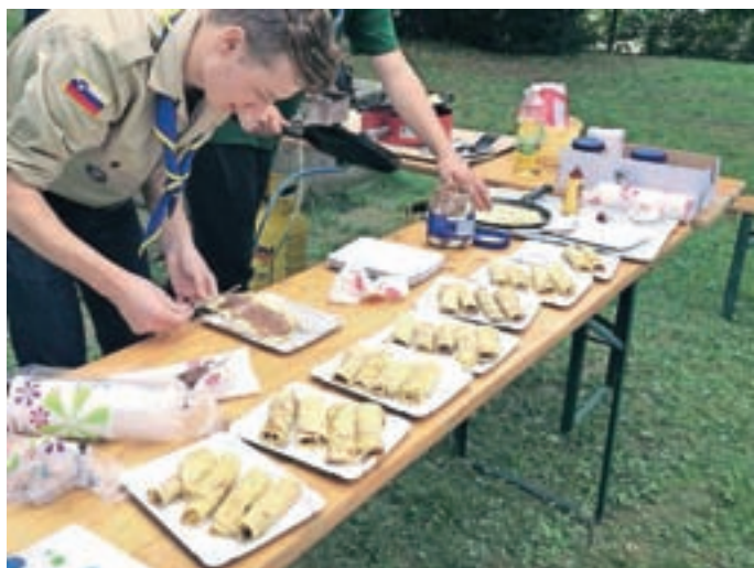
Konec septembra smo za učence OŠ Železniki pekli palačinke.

Eden od taborniških zakonov pravi: Tabornik je veder. Na orientaciji smo vsi vztrajali do konca, se imeli fino in celo sonce je razkadilo oblake ter nam narisalo dobro voljo na obraz.