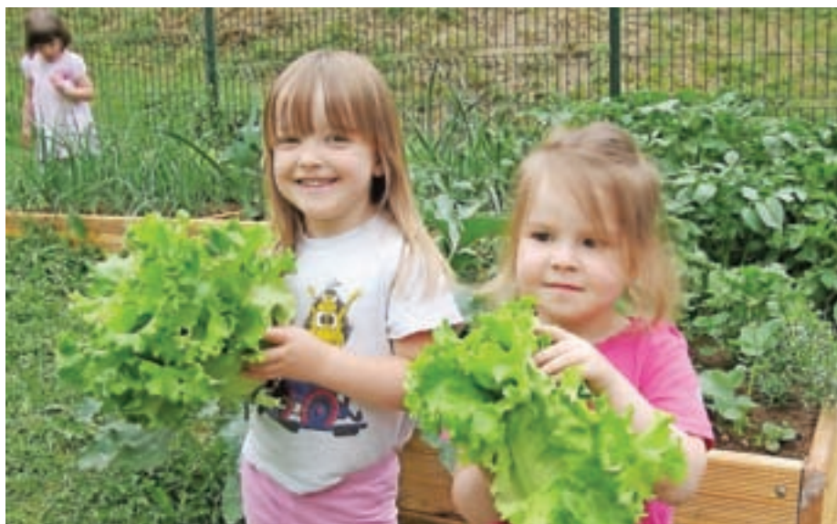
Solata bo za kosilo.

Največja pridobitev za otroke na tem področju v zadnjem letu pa je otroški vrtiček, ki je postavljen na travniku našega igrišča pri vrtcu. Vanj smo posadili in posejali semena in letina je bila zelo bogata. Otroci pridno skrbijo za rastoče rastline. Kuharica rada uporabi zelišča in zelenjavo, ki jih otroci z vrta prinesejo v kuhinjo. Še posebej dobro so nam uspele buče in čebula, tudi krompirja smo pridelali za eno kosilo. Otroci zelo dobro poznajo rastline, ki rastejo na vrtu, in jih tudi raje uživajo, ko jih sami naberejo in pomagajo pripraviti, na primer zelenjavno juho. Vsi se radi ustavimo ob vrtičku in se veselimo, ko lahko prispevamo svoj delež v kuhinji in tako obogatimo naše jedi s svežimi zelišči in zdravo zelenjavo.