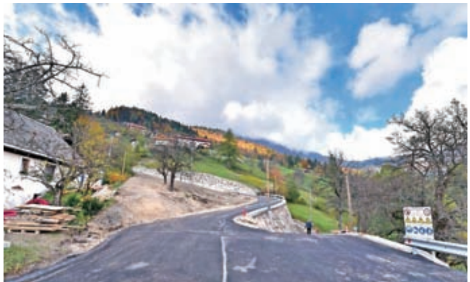
Odsek Gotnar–Kovač v Podlonku po rekonstrukciji

Prav tako še vedno poteka tudi največja letošnja občinska investicija, 189 tisoč evrov vredna rekonstrukcija dotrajanega odseka Sivar–Logar proti Megušnici. Ta teden so na tem odseku izvedli še hidroizolacijo obnovljenih mostov, ki jo je ovi-