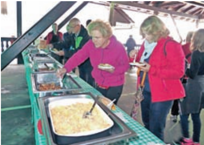
Obiskovalci so lahko poskusili tudi nevsakdanje jedi iz zelja.

Prireditve, posvečeno zaloškemu zelju, je spremljala tudi razstava o poplavah.