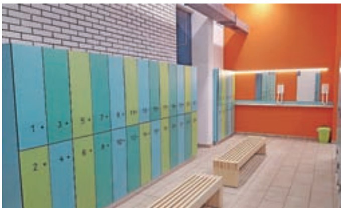
Prenovljene garderobe v bazenu

Septembra so animatorke v okviru 6. Iger JZR pripravile tudi igre Mladinskega centra. Vsako sredo popoldne so v Mladinskem centru prisotne študentke – animatorke, ki skrbijo za animacijo obiskovalcev. Pripravljajo tudi razne delavnice za osnovnošolce, točen razpored objavljajo na internetni in Facebook strani Mladinskega centra Železniki.