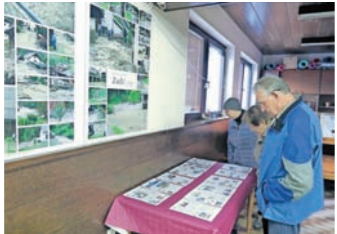
Razstava ob deseti obletnici poplav

Precej pozornosti je pritegnila razstava fotografij in časopišnih člankov o poplavah leta 2007, ki je bila skupaj z razstavo ročnih del domačink na ogled v kulturnem domu. V sklopu Praznika zelja so pripravili tudi večer komedije s Turističnim društvom Žirovski Vrh ter za konec še vaško druženje in nastop čarovnika.