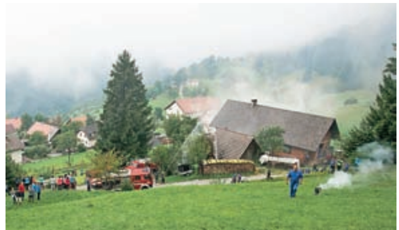
Pogled na gorečo hišo