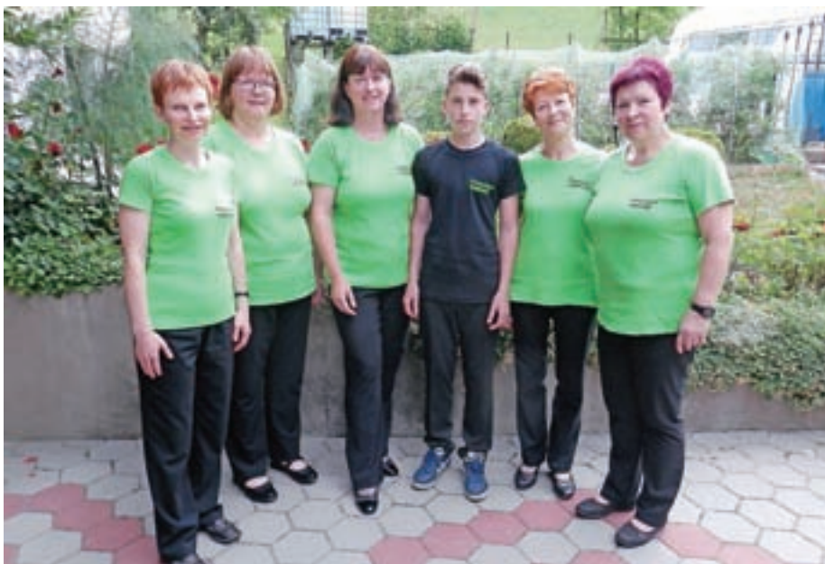
Francetovi orgličarji pripravljajo zanimiv glasbeni večer in vabijo k obisku. Vstop bo prost.