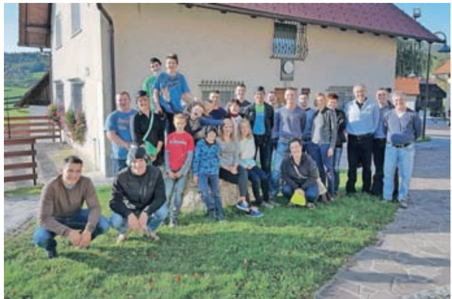
Dražgoški igralci, ki so uprizorili Krekovo burko Cigan čarovnik, s spremljevalci pred župniščem v Šentjanžu, kjer je Krek umrl.