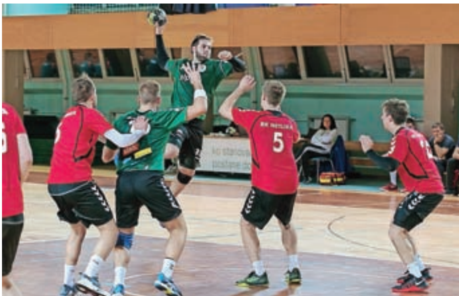
Rokometiši Alplesa so na prvi domači tekmi v tej sezoni z 31 : 24 premagali Metliko.

Med samo obnovo smo spoznali, da imamo v društvu posameznike, ki se rade volje odzovejo tudi takrat, ko je treba kaj postoriti. V vsakem primeru pa v društvu delajo ljudje, ki za svoje delo ne dobijo niti centa in ga opravljajo zelo dobro. Te stvari opravljajo v prostem času,