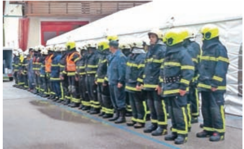
Postroj udeležениh gasilcev in gasilk

Isto nedeljo popoldne so že peto leto zapored potekale Medvaške igre med vaščani Dražgoš in Podblice z okolico, ki jih organizirata Športno društvo (ŠD) Dražgoše in ŠD Bela peč - Podblica. V devetih različnih disciplinah se je pomerilo približno