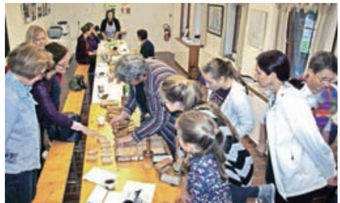
Izdelava loških kruhkov