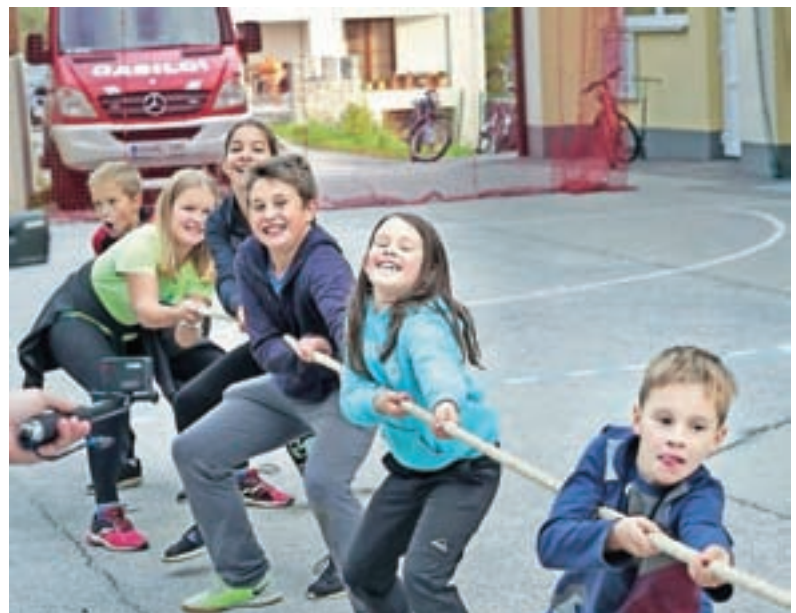
Otroci pri vlečenju vrvi