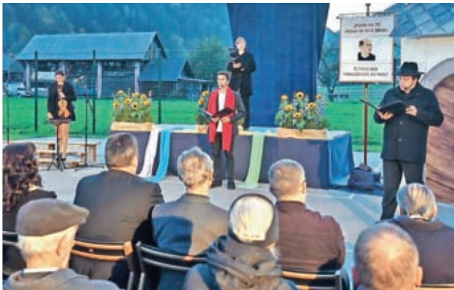
Slavnostna akademija na predvečer stote obletnice Krekove smrti