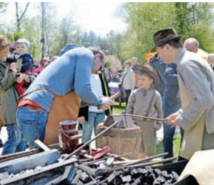
Prikazali smo tudi kovanje žebeljev.

Nedeljski program bo podoben kot v prejšnjih letih, poleg predstavitve domačih obrti, klekljarskega spreveda in tekmovanja pa med drugim prinaša tudi nastope lajnarjev.