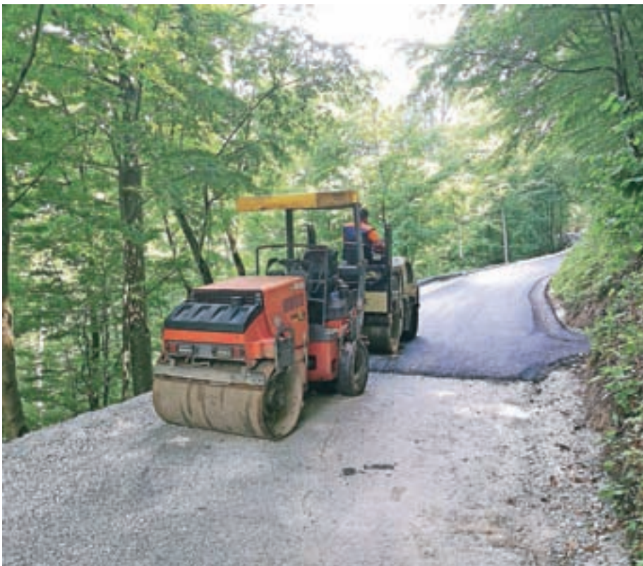
V rekonstrukcijo kilometra lokalne ceste Šurk–Ravne, ki so jo ta teden asfaltirali, bo občina vložila 137 tisoč evrov.