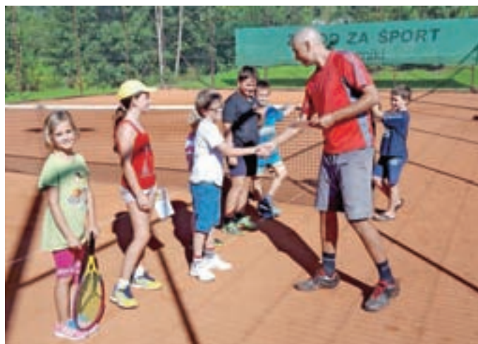
Podajanje diplom udeležencem otroškega tečaja tenisa izpred dveh let