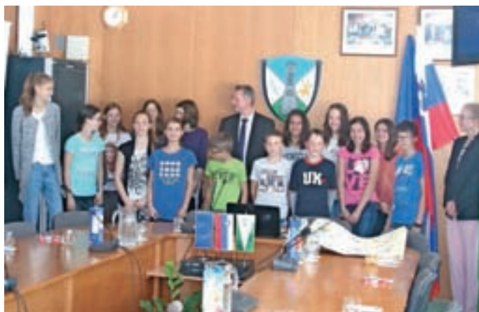
Poslanski skupini šestega in osmega razreda