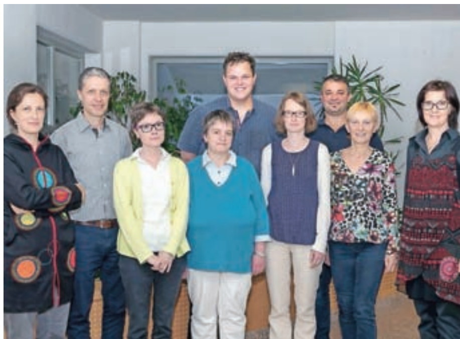
Organizacijski odbor za izvedbo evropskega projekta Europe2Gether

Prvi dan bo poudarek na železnikarski in slovenski čipki, ki jo letos pripravljajo za nominacijo za Unescov seznam nesnovne dediščine. "Naslednji dan, v četrtek, bo slavnostno dopoldne namenjeno čipkarski šoli, ker so Železniki ena redkih občin, ki podpira dodaten program čipkarske šole in s tem prenos dediščine s starejših na mlade, kar je osrednja os našega evropskega projekta. Zvečer bo slavnostno odprtje Čipkarskih dnevov, na katerem bodo predstavljeni tudi referati