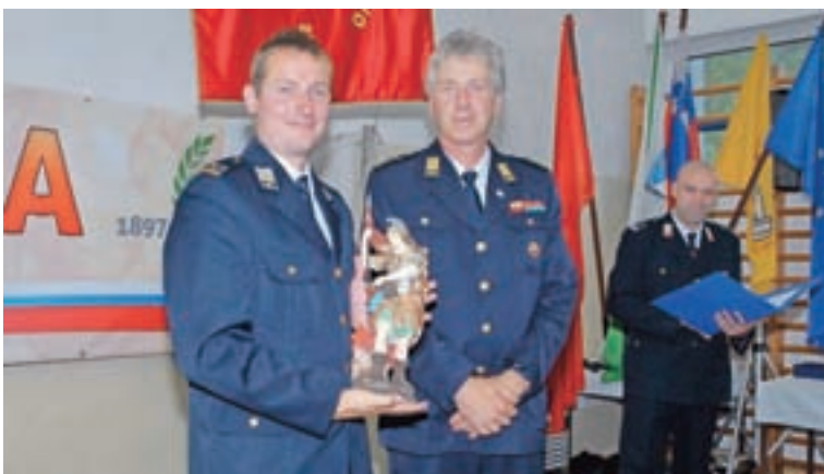
V PGD Selca so ob jubileju od Gasilske zveze Škofja Loka prejeli kipec Florijana.