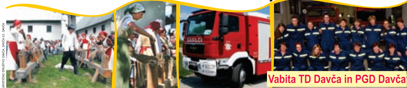
Vabita TD Davča in PGD Davča