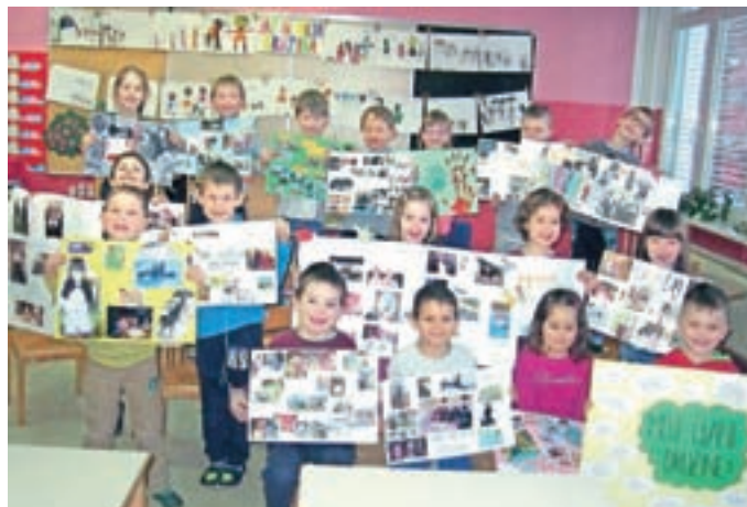
Predstavitveni plakati družin

V skupini Čebelice smo se v teh dneh poslovili od prijateljev iz sodelujoče skupine Pedenjped iz vrtca Navihanček iz Središča ob Dravi. Skozi celo šolsko leto smo preko spletne aplikacije in video omrežja sodelovali s petimi različnimi tematskimi sklopi: To sem jaz, Jaz in moja družina, Jaz in moj vrtec, Jaz in moje mesto, Jaz in moja država. Najprej smo razmišljali o sebi, pridobivali socialne veščine vzpostavljanja stika z drugimi, iskali podobnosti in razlike otrok sveta. Najpomembnejši izdelek za predstavitev na video klicu je bila osebna izkaznica s prikazom svojih značilnosti in posebnosti. Pri izvajanju druge teme smo k sodelovanju povabili starše. Vsak otrok je doma ob pomoči starša izdelal plakat o svoji družini, ki ga je predstavil svojim prijateljem v vrtcu in na video klicu. V vrtcu smo povabili stare starše, jim predstavili kratek program, srečanje pa nadaljevali ob družabnih igrah. Vrtec smo predstavili na podlagi izmišljenih ugank o logotipih skupin, z izbranimi fotografijami otrokom najljubših dejavnosti in izdelano maketo vrtca. Zelo smo uživali v spoznavanju simbolov, znamenitosti, domačih obrti svojega mesta. Predstavili smo grb, klekljanje, izdelane dražgoške kruhke ter ljudsko rajalno