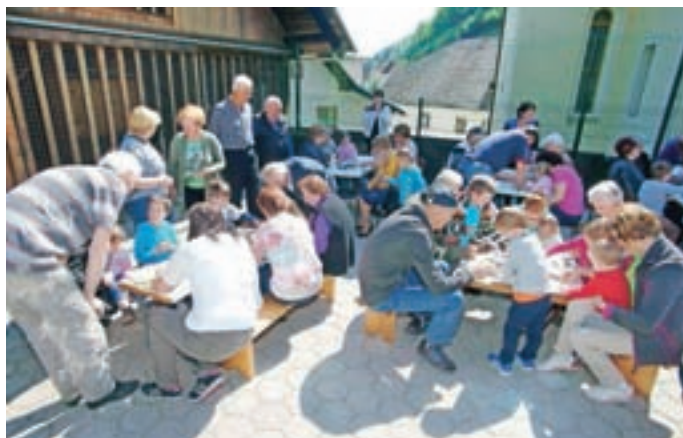
Delavnica s starimi starši

Kdor ima vnuke, ve, kakšna sreča je to, kakšna obogatitev življenja in dopolnitev nečesa neizrekljivo lepega. Le kdo se ne spominja trenutkov, ki jih je preživel s svojimi starimi starši? Lahko so bili vsakdanji, ali pa zelo redki, pa vendarle so ostali za vedno v našem spominu. Kaj pa je tako posebnega, da se to dogaja iz generacije v generacijo? Mislim, da ima pomembno mesto prav