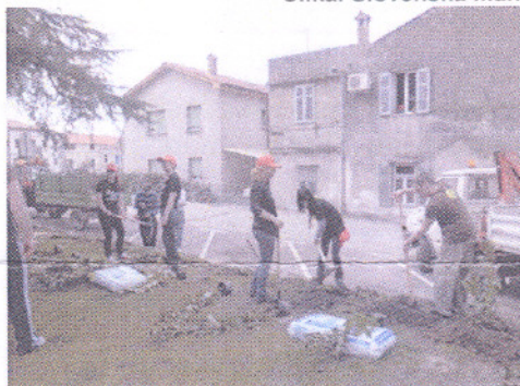
Slika: Slovenska filantropija na delu v Izoli, 2010

je v Izoli pripravila akcijo urejanja parka. V sodelovanju z občino Izola smo uredili park pri otroškem igrišču Birba in Kulturnem domu. Postavili smo ograjo, ki je ločila park od parkirišč in tako obiskovalce parka boljše zavarovala, park pa polepšala s klopmi in koši za smeti.